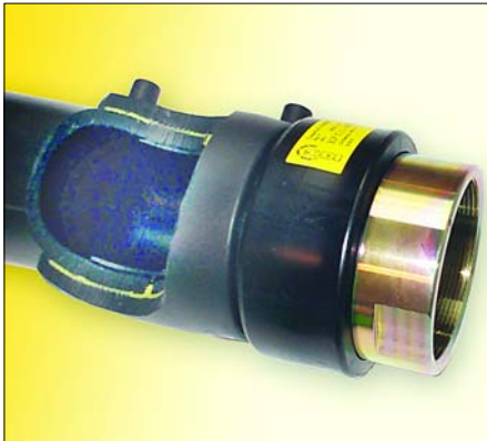
Die Kunststoffrohrleitungen zu den unterirdischen Tanks sind mit einer metallischen Rohrleitung verbunden, welche die Erdoberfläche durchstößt und am Einfüllstutzen endet.

Messungen an einem Probestück des Kunststoffrohrs, auf dem eine Fläche von 3.000 Quadratmillimeter mit einem Wasserfilm bedeckt war, ergaben eine Kapazität von 30 Picofarad. Beim gegebenen Innendurchmesser des Rohrs von 91 Millimeter wird diese Kapazität bereits bei einer Länge des Wasserfilms von 10 Millimeter er-